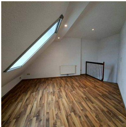
Schlafen / Büro DG