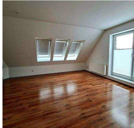
Wohnen / Essen