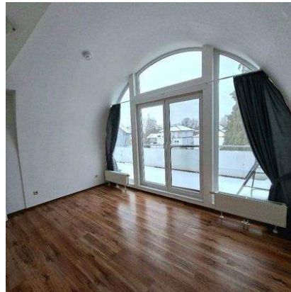
Schlafen / Büro