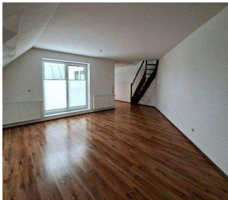
Wohnen / Essen